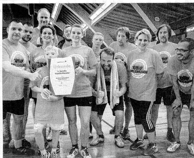
Erstmals dabei und gleich bis ins Finale eingezogen: die Freizeithandballer vom Familienverband Magdeburg wurden Zweiter.